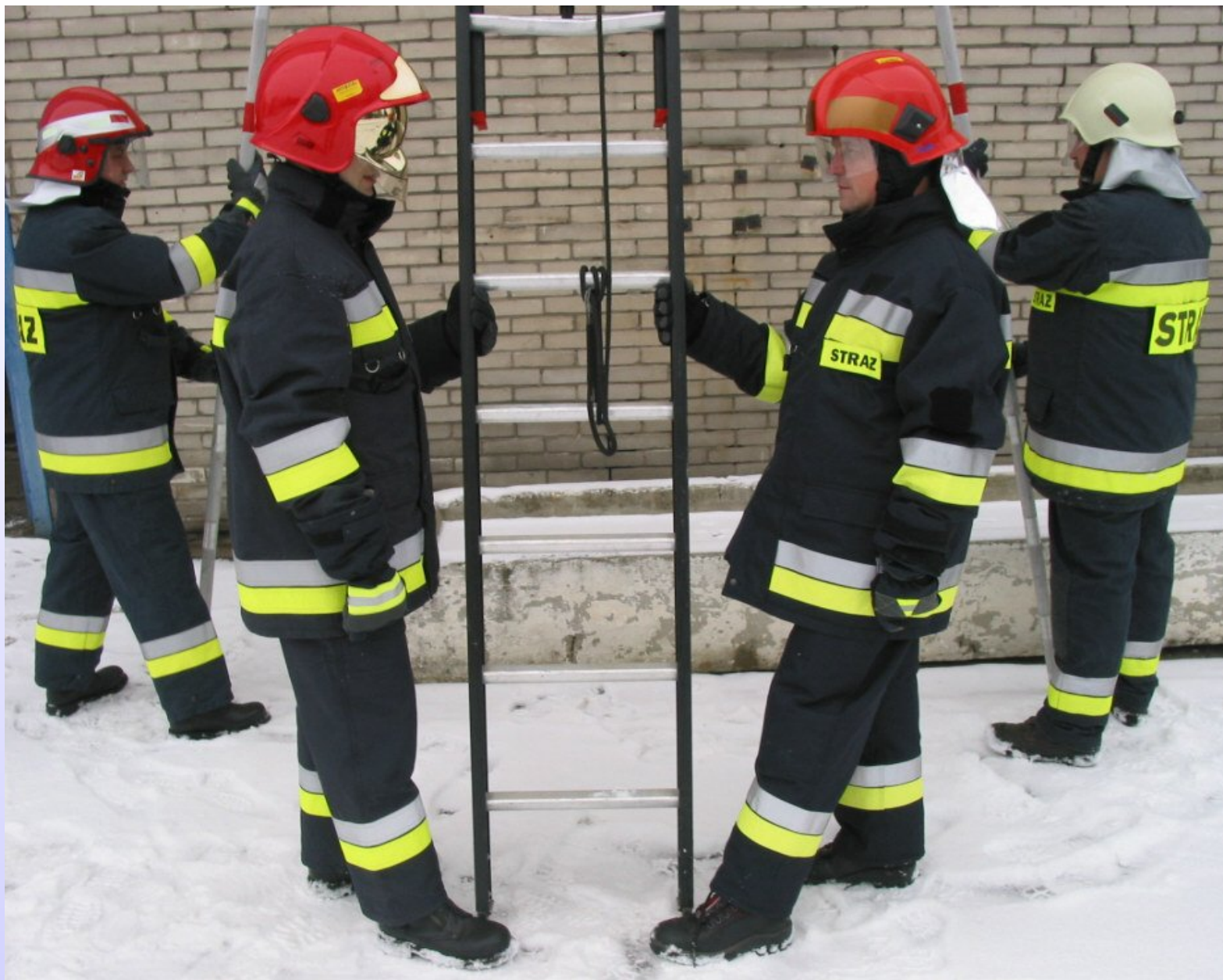
Asekuracja pracujących na drabinie.