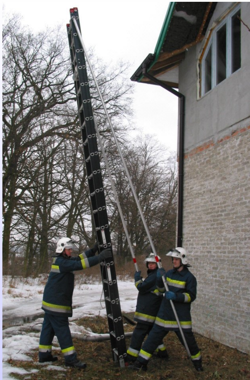
Pozycja przed oparciem drabiny o ścianę