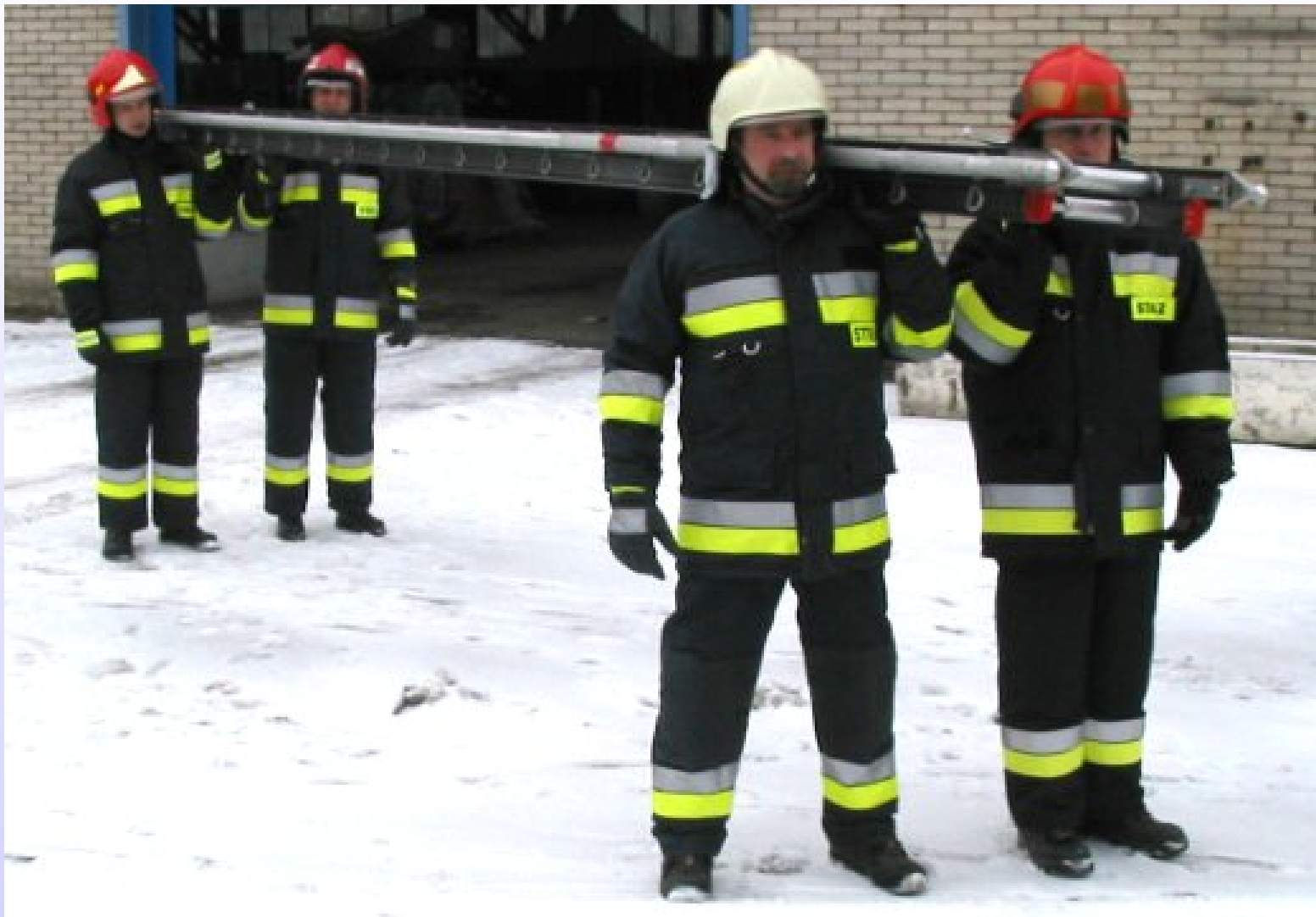
Transport drabiny na miejsce akcji