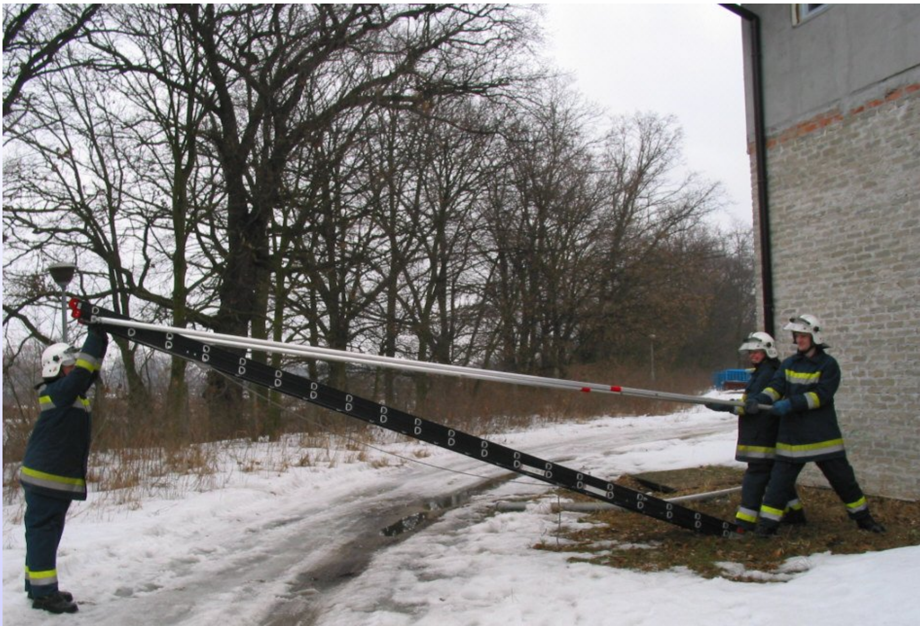
Podnoszenie drabiny do pozycji pionowej.