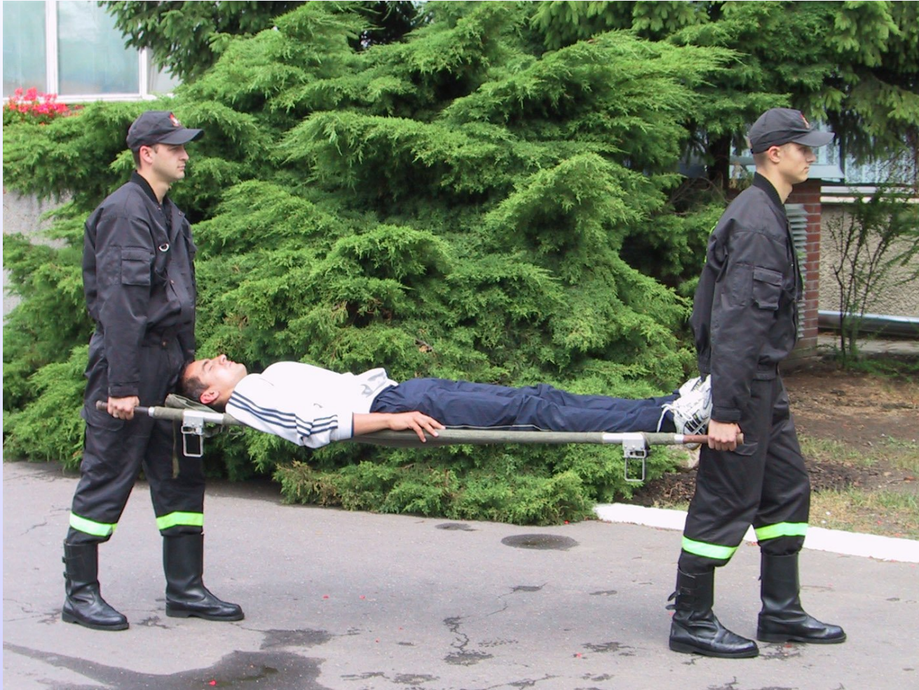
Transport za pomocą noszy