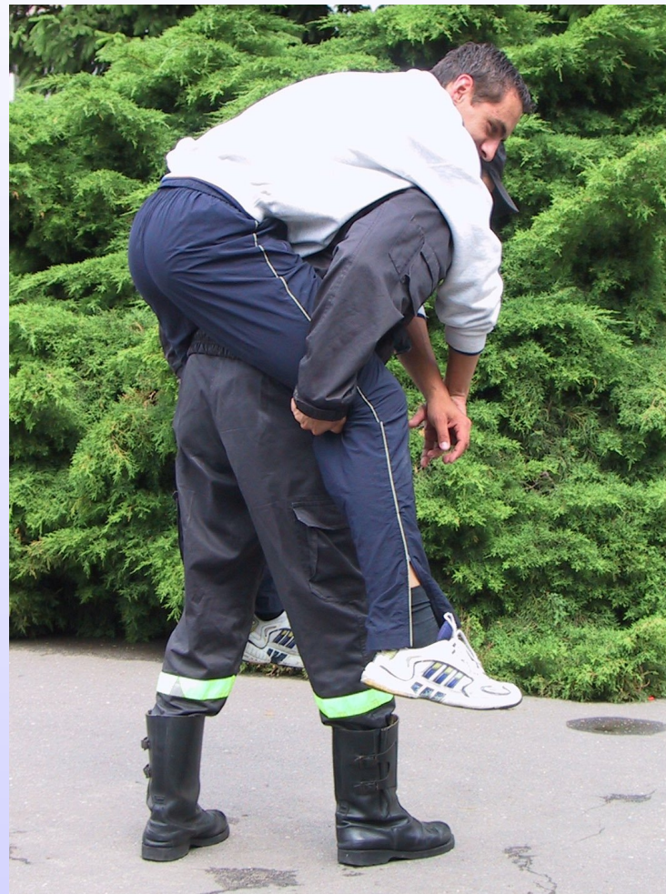
Chwyt „na barana”